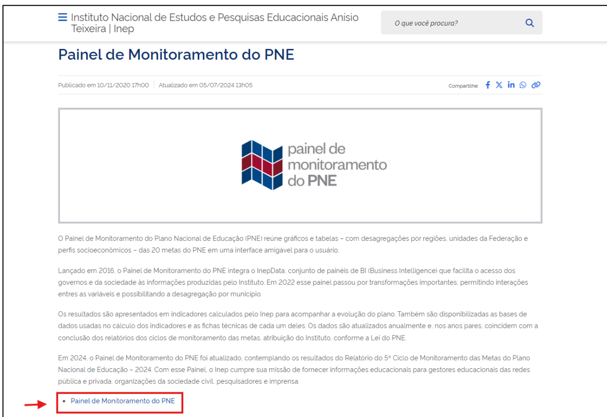
Tela 1: Painel de Monitoramento do PNE

Os dados necessários para definição do Indicador são obtidos por meio do acesso ao Painel de Monitoramento do PNE - INEP . Para abrir o Painel clique em Painel de Monitoramento do PNE, conforme Tela 1.