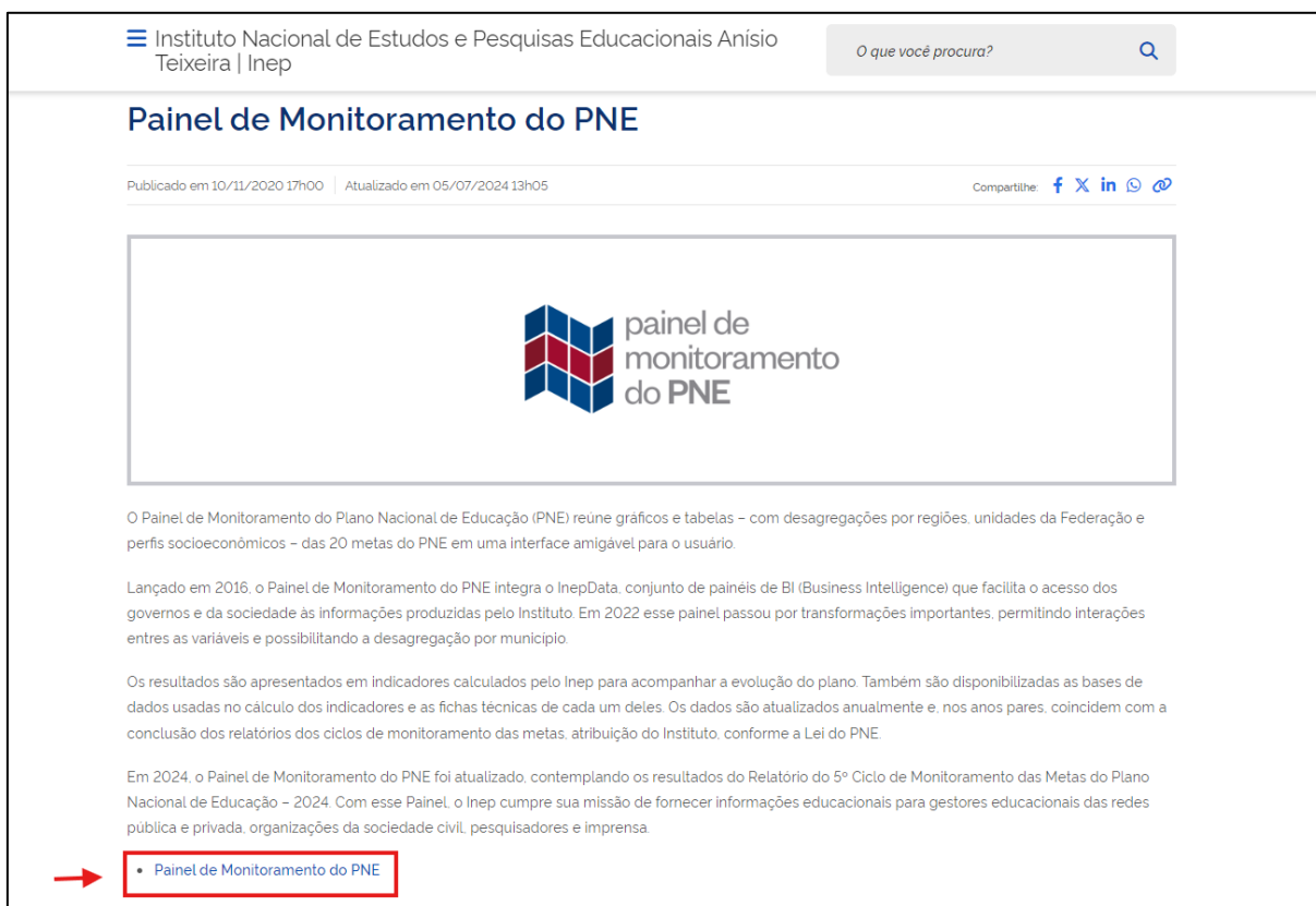
Tela 1: Painel de Monitoramento do PNE – INEP.

Os dados necessários para definição do Indicador são obtidos por meio do acesso ao Painel de Monitoramento do PNE - INEP . Para abrir o Painel clique em Painel de Monitoramento do PNE, conforme Tela 1.